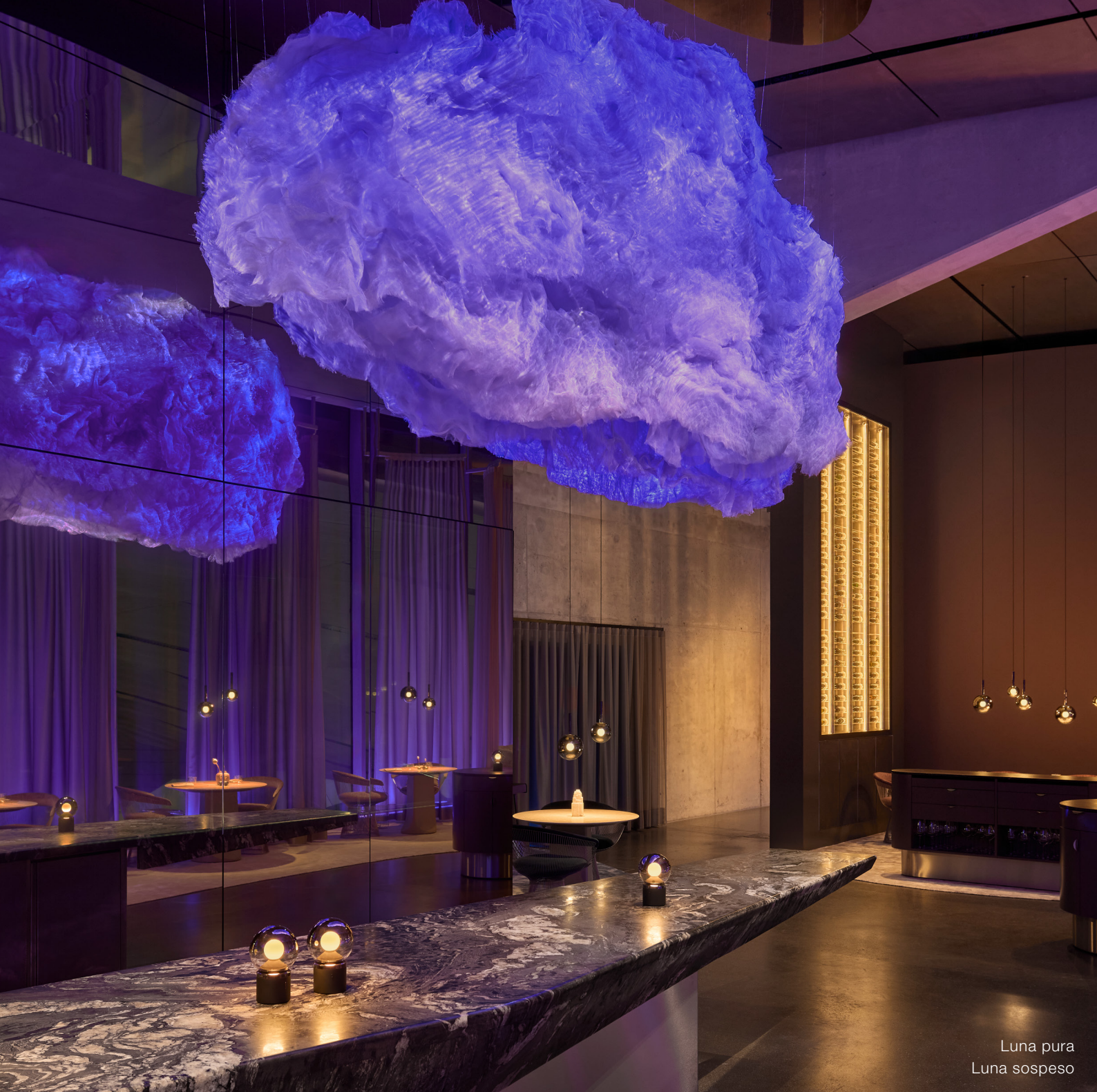
Luna pura Luna sospeso